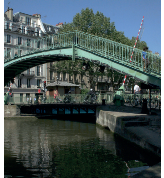
La passerelle Alibert

Dernièrement, TRIBVN Imaging a été sollicité pour préserver de précieuses cartes historiques de l'IRFA. Les experts ont numérisé une soixantaine de plans, cartes et croquis d'Asie, datant de la fin du XIX e et du XX e siècles.