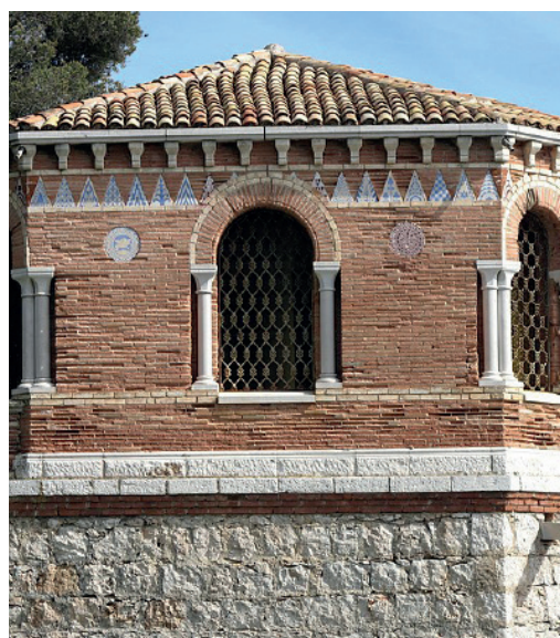
Villa Cypris à Roquebrune-Cap-Martin

Le Paglia Orba, navire mixte de Corsica Linea, a été numérisé en 3D par AGP afin de capturer avec précision ses 165,8 mètres de long et 29,2 mètres de large. Construit entre 1992 et 1994, ce ferry est dédié au transport de passagers et de fret entre Marseille et la Corse, avec 137 cabines privatives sur ses 9 ponts. Ce modèle 3D offre une vue détaillée et fidèle du bateau.