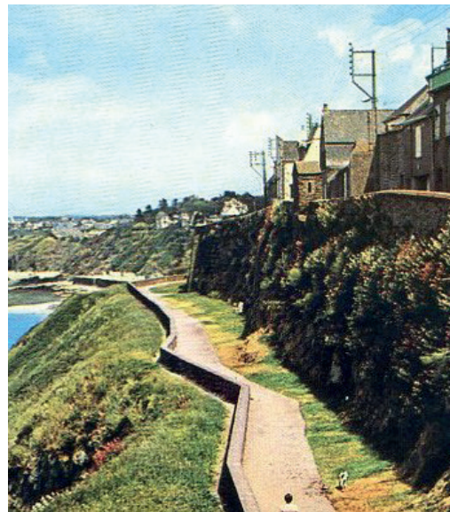
Les Remparts de Granville

L'entreprise French Lines & Compagnies a fait appel à Arkhênum pour réaliser diverses numérisations : cahiers en 2011, plaques de verre en 2013 et affiches en 2021. Cet établissement, situé au Havre, conserve, valorise et diffuse l'histoire de la Marine marchande française, incluant les fonds historiques de compagnies comme la Confédération Générale du Travail (CGT), les Messageries Maritimes et la Société nationale maritime Corse-Méditerranée (SNCM).